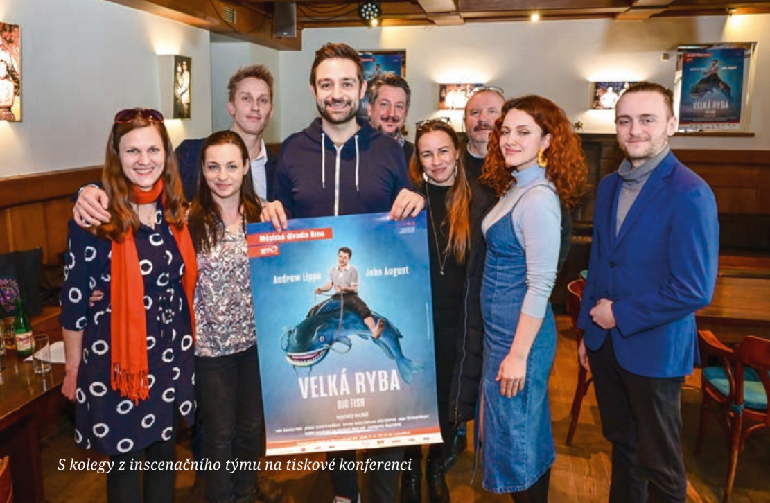
S kolegy z inscenačního týmu na tiskové konferenci