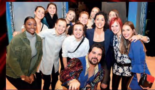
Na repríze muzikálu Mamma Mia! se sešel tým basketbalistek KP Brno.