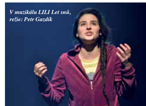
V muzikálu LILI Let snů , režie: Petr Gazdík

Nedělám věci s jasnou představou, jak by to mělo být. Většinou pouze něco očekávám a tohle očekávání se mi naplnilo. Věděla jsem, že budu najednou „vidět“. Nechci předstírat, že mě ten