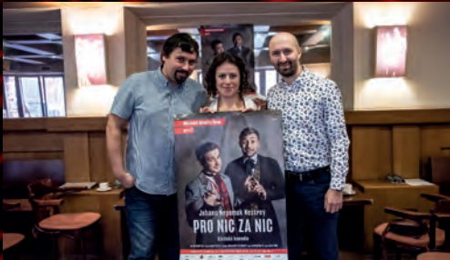
Před uvedením nové komedie nemohla chybět ani tisková konference,...