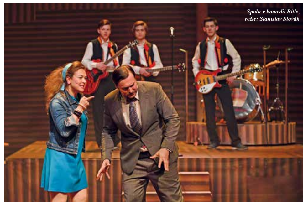
Spolu v komedii Bítls , režie: Stanislav Slovák

Petr: Tady musím především říct, že já jsem v Bítls původně vůbec hrát nechtěl. A ve všech