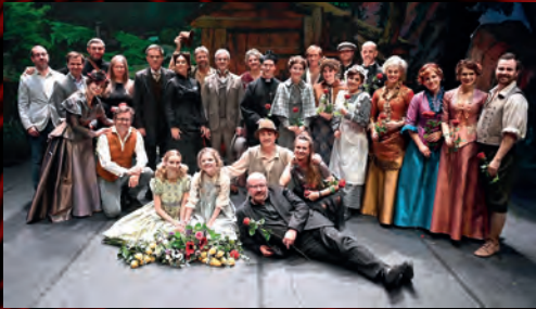
Na začátku prosince proběhla ve Vídni premiéra muzikálu Heidi.