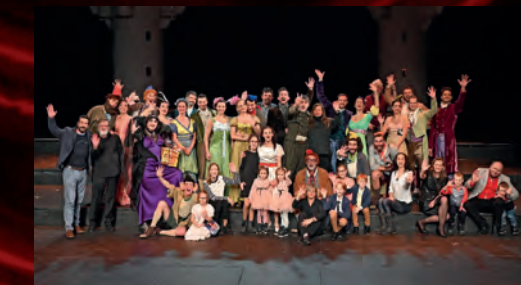
Třetí adventní víkend proběhla stá repríza muzikálové pohádky Sněhurka a sedm trpaslíků.