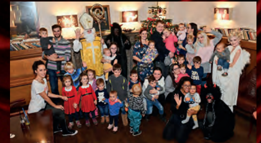
Již tradičně se v Divadelním klubu sešly děti našich kolegů s Mikulášem, čerty a andělem.