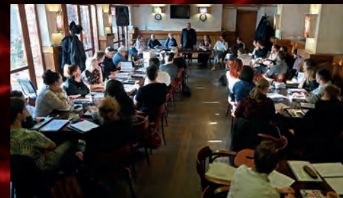
... který měl zabavovací zkoušku v prostorách Divadelního klubu.