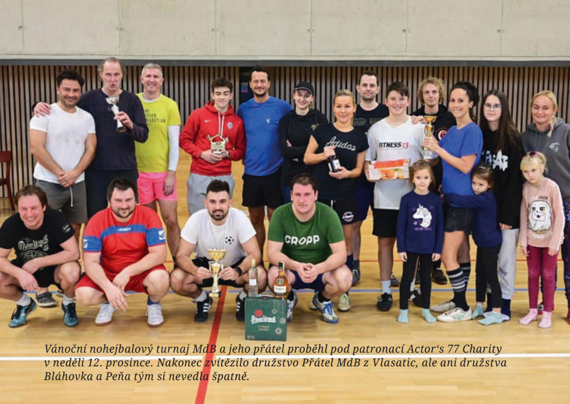
Vánoční nohejbalový turnaj MdB a jeho přátel proběhl pod patronací Actor's 77 Charity v neděli 12. prosince. Nakonec zvítězilo družstvo Přátel MdB z Vlasatic, ale ani družstva Bláhovka a Peňa tým si nevedla špatně.