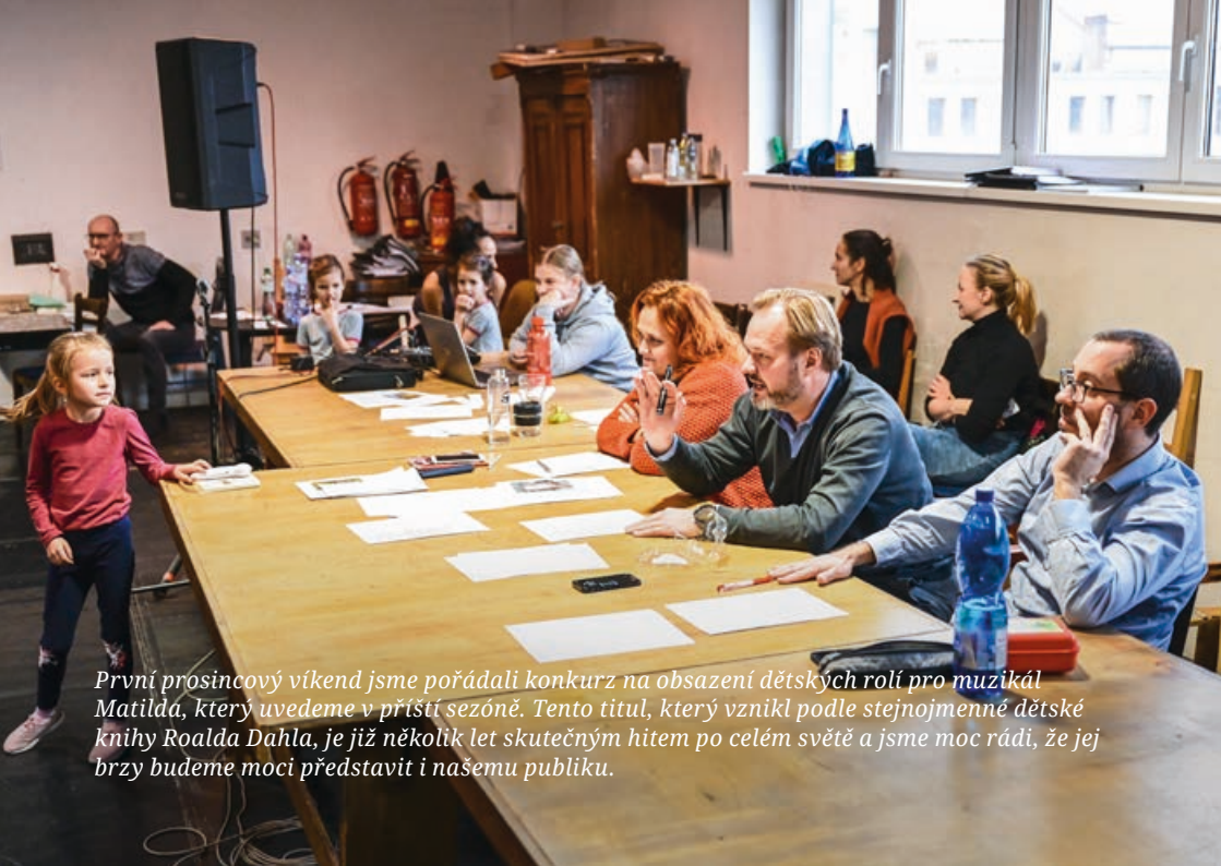
První prosincový víkend jsme pořádali konkurz na obsazení dětských rolí pro muzikál Matilda, který uvedeme v příští sezóně. Tento titul, který vznikl podle stejnojmenné dětské knihy Roalda Dahla, je již několik let skutečným hitem po celém světě a jsme moc rádi, že jej brzy budeme moci představit i našemu publiku.