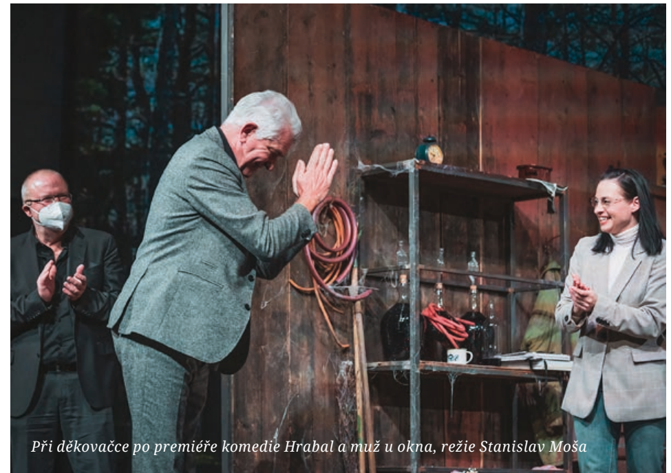
Při děkovačce po premiéře komedie Hrabal a muž u okna, režie Stanislav Moša