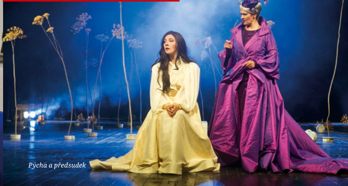
Pýcha a předsudek

a i ve svých vzpomínkách se na ni díval, jako by šlo pokaždé o někoho jiného. Jako by měla několik různých životů. Rozhodně to ale není hra o jeho matce, to v žádném případě, ona byla jen inspirací. Celá hra je spíš úvaha, je to o tom, co může hra Mary Page odkrýt ve vás pro vás. Zpřítomnil myšlenku, že se člověk může v různých fázích jevit velmi různorodě. A to nejen ostatním, ale i sám sobě může připadat jako tajemství. Schválně, kterých jedenáct obrazů ze svého života bys vybrala jako klíčové? A nevybrali by tví blízcí úplně jiné momenty? A věděla Mary Page , když prožívala jednotlivé okamžiky, jednotlivé scény, že to mohly být zlomové okamžiky pro její další osud?