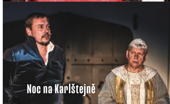
Noc na Karlštejně