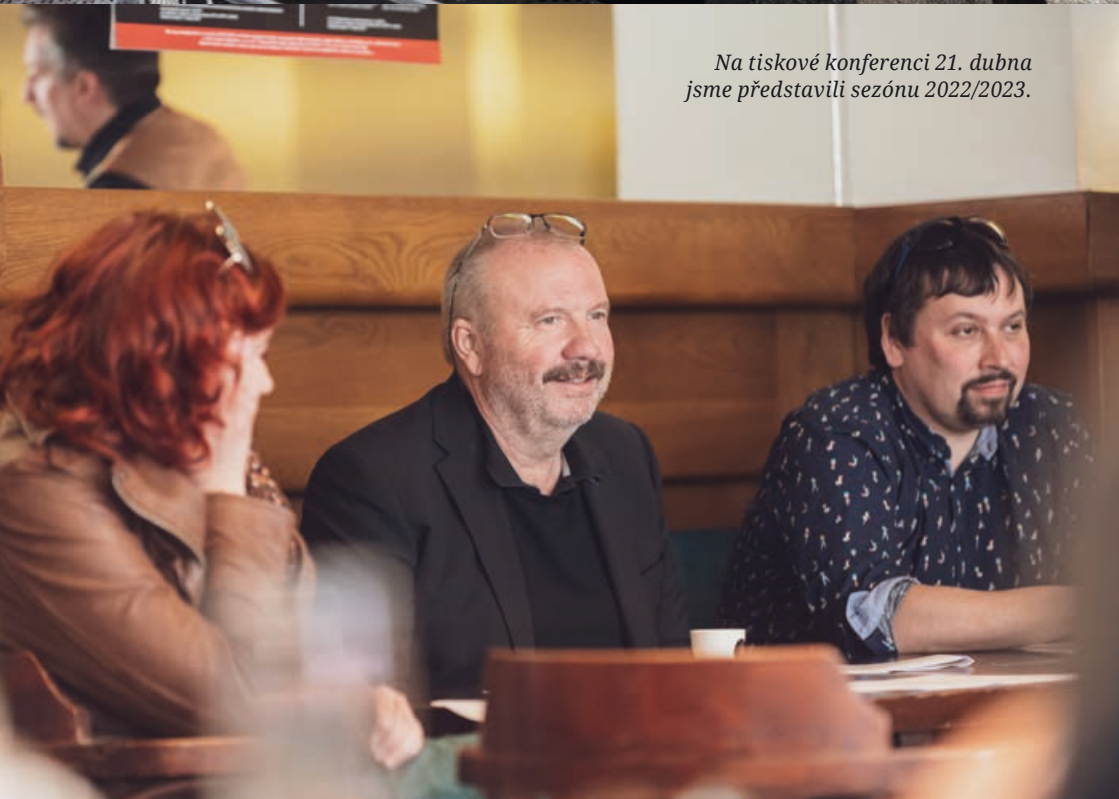
Na tiskové konferenci 21. dubna jsme představili sezónu 2022/2023.