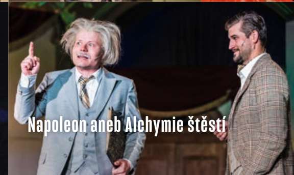
Napoleon aneb Alchymie štěstí