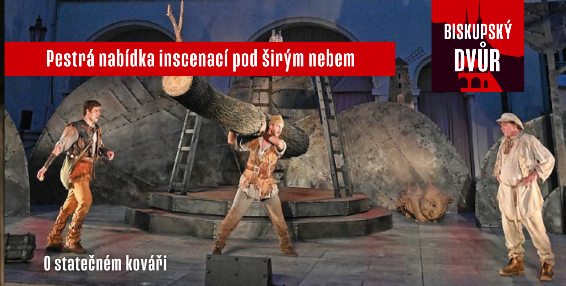
O statečném kováři