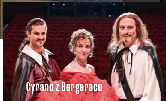
Cyrano z Bergeracu