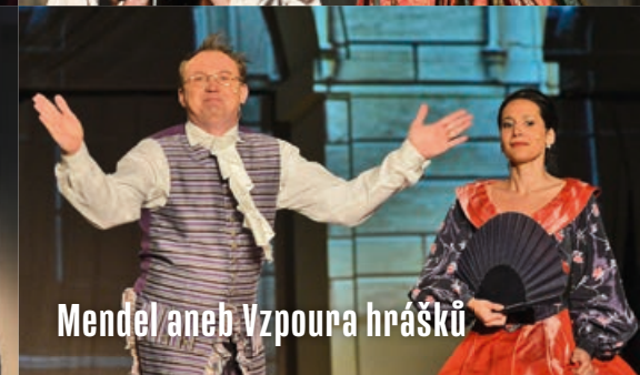
Mendel aneb Vzpouora hrášků