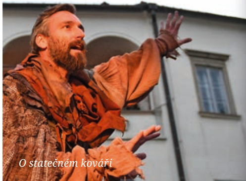
O statečném kováři

letos odehrál všech 37 představení na Biskupském dvoře. Kolegové mu za to udělili cenu „Zlatého Biskupčka“.