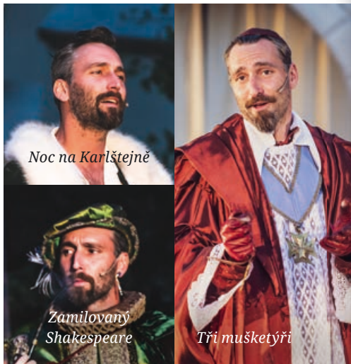
Noc na Karlštejně