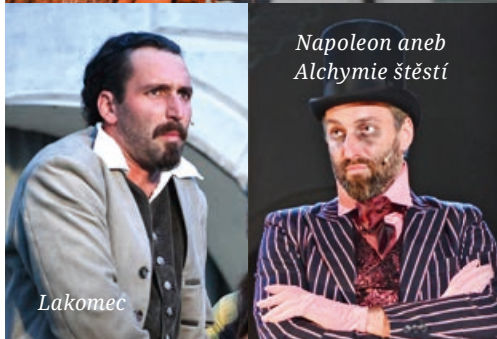
Napoleon aneb Alchymie štěstí