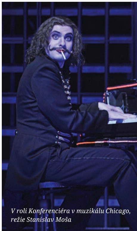
V roli Konferenciéra v muzikálu Chicago , režie Stanislav Moša

V našem divadle působíš, je to neuvěřitelné, ale je to tak, už téměř čtvrtstoletí. Máš nějaké srdcovky? Někaké oblíbené muzikálové kousky?