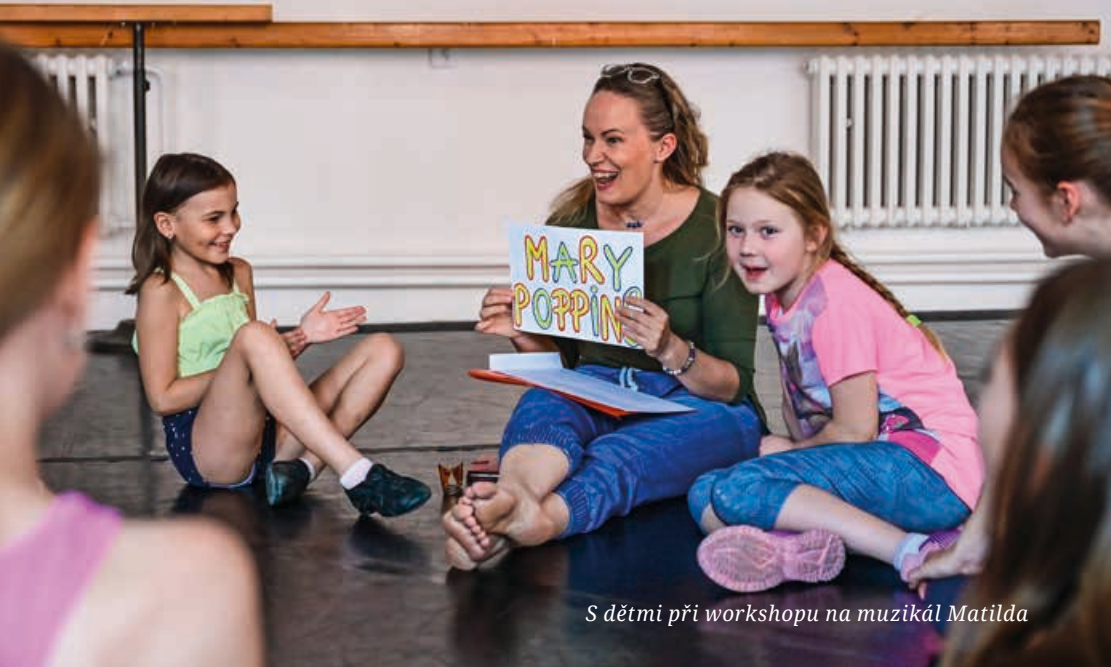
S dětmi při workshopu na muzikál Matilda

Kniha džungle, já hrála Rakšasí, on tygra Šér Chána – po třiceti letech se tedy potkáváme, což je velká výzva, protože jsme manželé, napojené bytosti, které se milují, nenávidí, škádlí, žárlí, pláčou spolu, smějí se, a to je velká cesta k tomu dojít. Je to risk a tenký led, jestli si budeme na jevišti pořádně naslouchat. Ale máme k tomu všechny předpoklady. (úsměv)