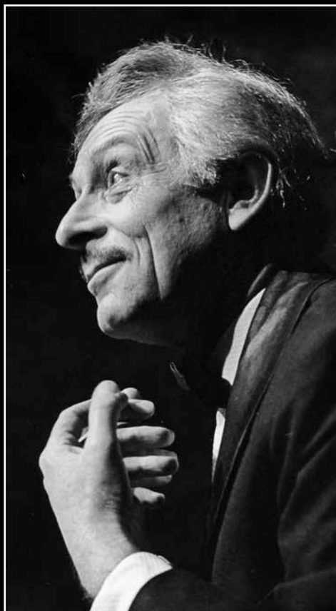
Jako Archie Rice v dramatu Johna Osbornea Komik / 1981