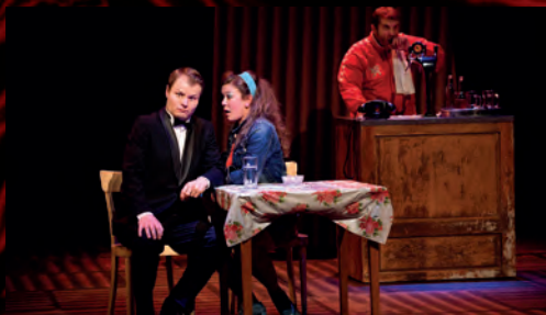
Stou reprízu Bítls jsme oslavili na jevišti...