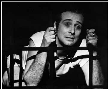
Jako Malvolio v Aprílové komedii, muzikálové variaci na Shakespearův Večer tříkrálový / 1968