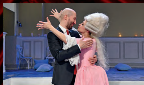
Režisér na premiéře gratulace rozdával...