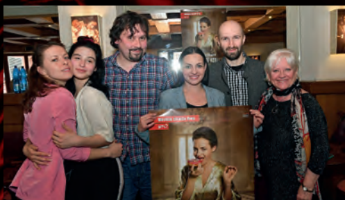
K premiéře nové inscenace Mikoláše Tyce Nebezpečné vztahy jsme samozřejmě uspořádali tiskovou konferenci.