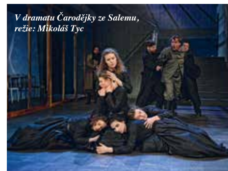
V dramatu Čarodějky ze Salem, režie: Mikoš Tyc

Paní Tourvelová je někým, kdo citovou manipulací nebo intriky nemá ve slovníku. Je to čistá, naivní duše s obrovským srdcem, které touží po pravdě a nedokáže žít ve lži, což se jí nakonec stane osudným. Odevzdá se něčemu, čemu věří, ale co zdanlivě nebylo pravdou. Jsem taky člověk, který neumí žít ve lži, což sice není vždy nejjednodušší, ale stojím si za tím, že je to správné. Nicméně vzhledem k tomu, že můj dosavadní herecký rejstřík zahrnoval především role silných a manipulujících žen, jsem ráda, že můžu pracovat na něčem naprosto novém. Musím se brzdít a hledat cesty, jak se stavět k situacím, které bych já řešila úplně jinak.