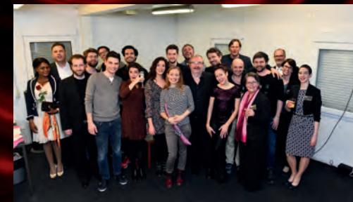
se svým česko-německým týmem pro švýcarské turné.