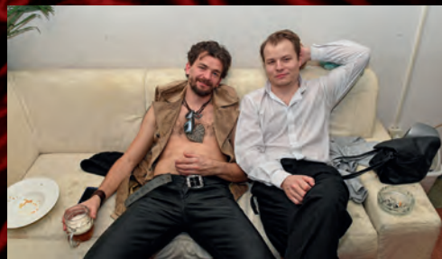
... i po představení.