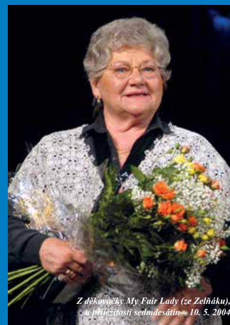
Z děkovačky My Fair Lady (ze Zelňáku ), u příležitosti sedmdesátin – 10. 5. 2004