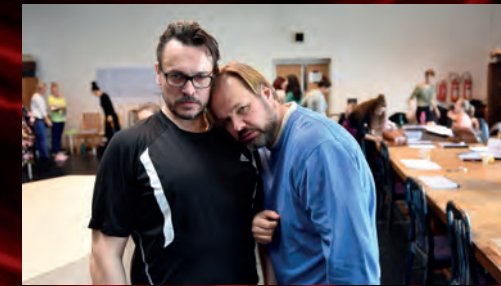
... představitelé hlavní mužské role mají práce až nad hlavu.