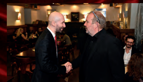
... i přijímal, ...