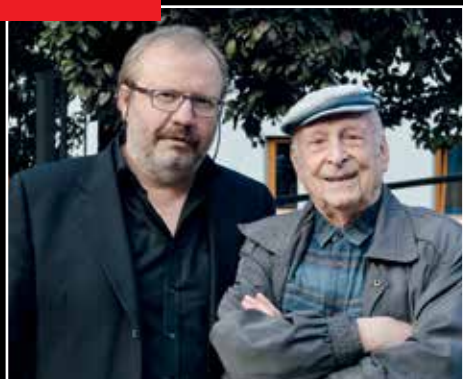
Se Stanislavem Mošou na dvoře Městského divadla Brno / 12. května 2014

Znamení herec a ohromný člověk. Odešel 14. března. Ve věku šestaosmdesátí roků. Do poslední chvíle naplnil své životní heslo: „Lepší se utahat, než zrezivět.“ Kus života spojil s Brnem: plných dvaadvacet sezón (1967–1989) hrál na jevišti Divadla bratří Mrštíků (dnešní MdB), v letech 1968–1975 působil také jako pedagog na konzervatoři (pak mu to bolševik zatrhł). „Z jeho věčně dobré nálady a laskavosti by se dala postavit katedrála,“ řekl o něm filmový režisér Jiří Strach.