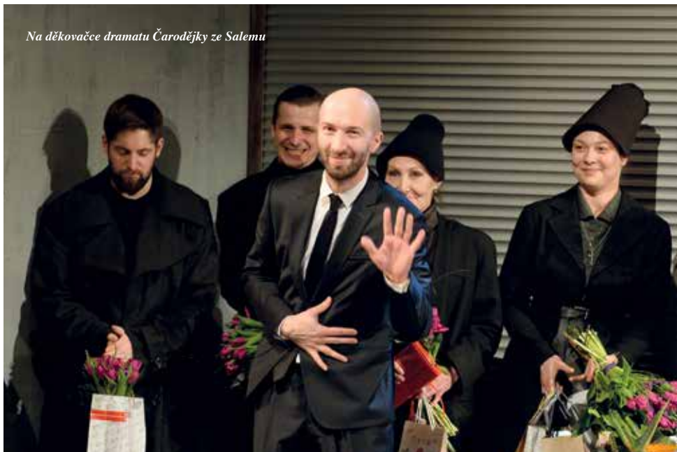
Na děkovače dramatu Čarodějky ze Salemu