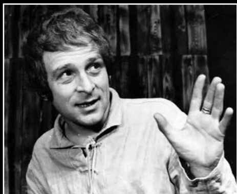
V titulní úloze Dürrenmattovy adaptace Shakespearova Krále Jana / 1970