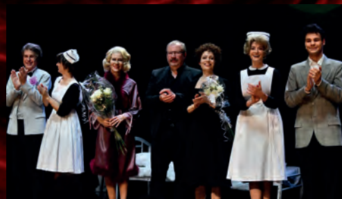
Nové nastudování inscenace Vrabčák a anděl...