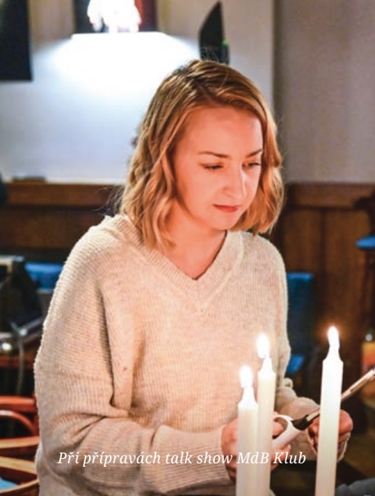
Při přípravách talk show MdB Klub