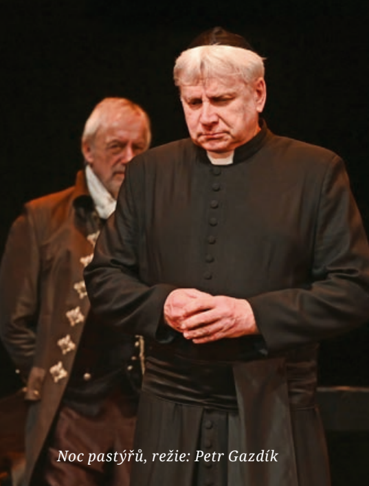
Noc pastýřů, režie: Petr Gazdík