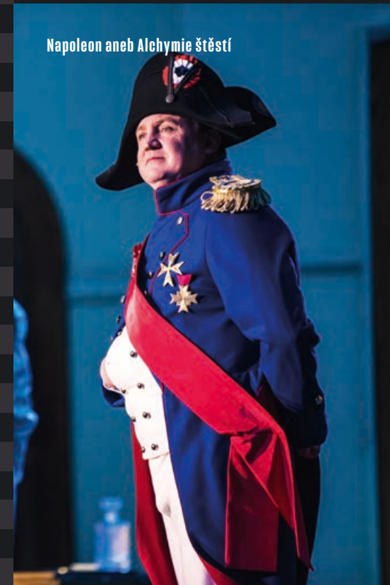
Napoleon aneb Alchymie štěstí