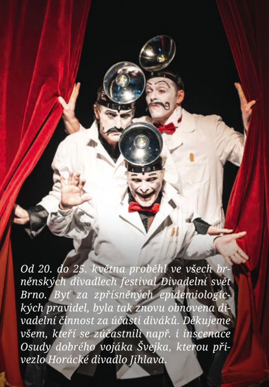
Od 20. do 25. května proběhl ve všech brněnských divadlech festival Divadelní svět Brno. Byl za zpřísněných epidemiologických pravidel, byla tak znovu obnovena divadelní činnost za účasti diváků. Děkujeme všem, kteří se zúčastnili např. i inscenace Osudy dobrého vojáka Švejka, kterou přivezlo Horácké divadlo Jihlava.