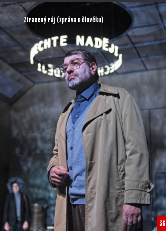
Ztracený ráj (zpráva o člověku)