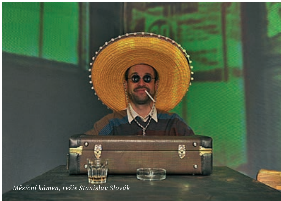
Měsíční kámen, režie Stanislav Slovák