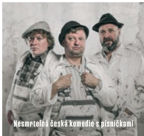
Nesmrtelná česká komedie s písničkami

Prouza: Neříkej mi šatnářkám matko! Tady ne!