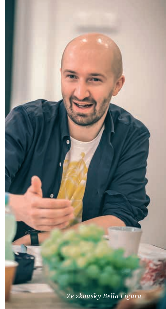
Ze zkoušky Bella Figura

Já Vánoce zbožňuji. Když jsem byl malý, tak jsme je trávili hlavně v Praze na sídlišti Chodov a tam to moc útulné nebylo, což mi ale jako dítěti ani moc nevadilo. Ale od určité doby trávíme Vánoce na chalupě v lesích u Zbiroha, na Křivoklátsku. A tam je to prostě nádherné. Nechybí krb, na stromku jsou zapálené klasické svíčky a má to úžasnou atmosféru. Teď se to proměňuje o to víc, že letošní Vánoce budeme poprvé zažívat s naším raubířem. I má sestra má malou dcerku a celá rodina je