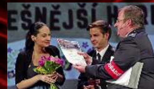
Nejoblíbenější herečku zvolili diváci již potřetí Andreu Zelovou.