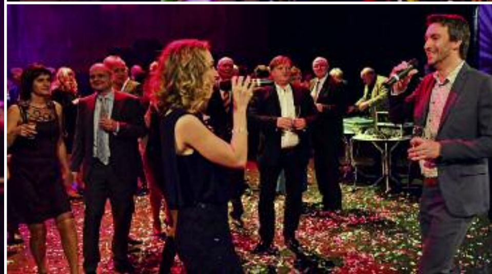
SILVESTROVSKÁ NOC NA ČINOHERNÍ SCÉNĚ