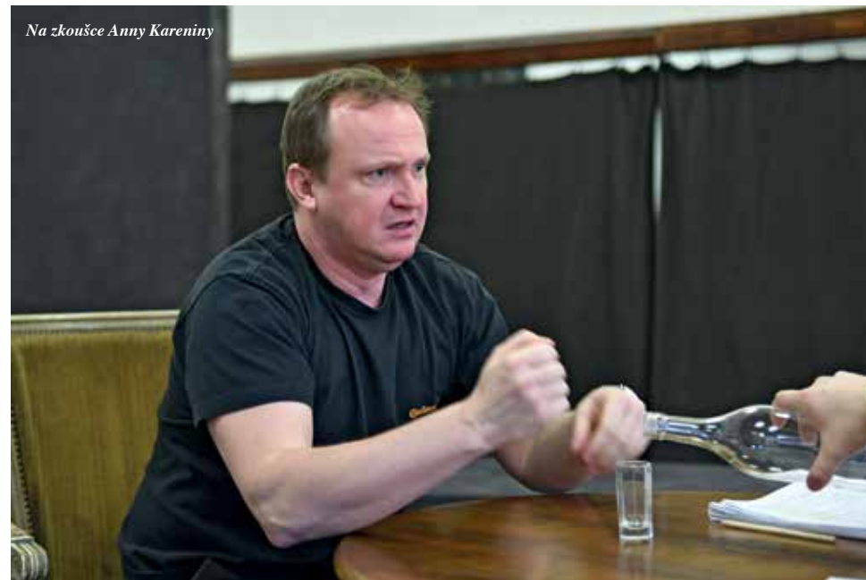
Na zkoušce Anny Kareniny