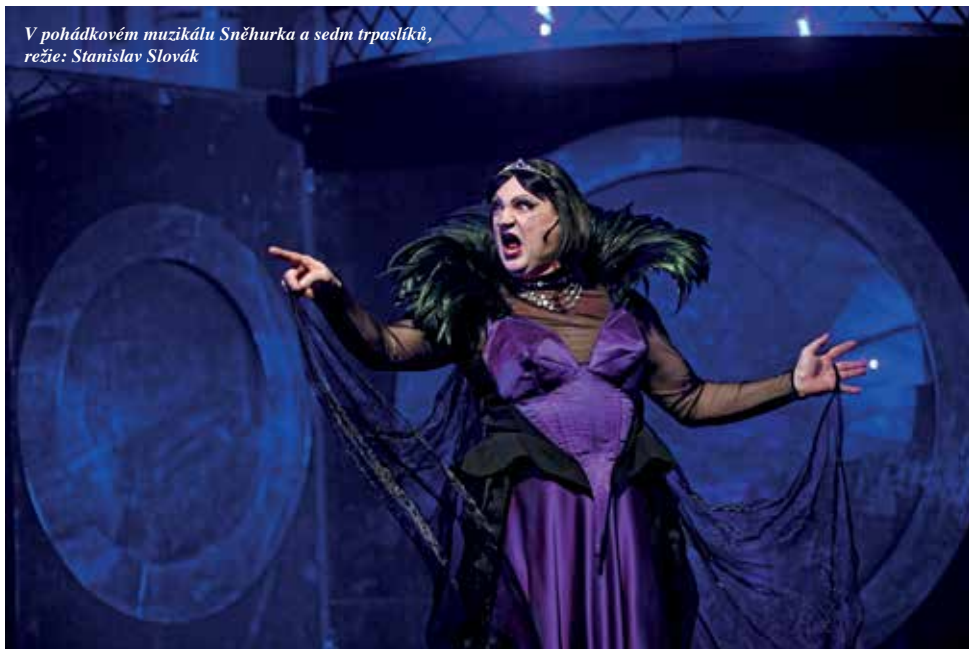
V pohádkovém muzikálu Sněhurka a sedm trpaslíků, režie: Stanislav Slovák