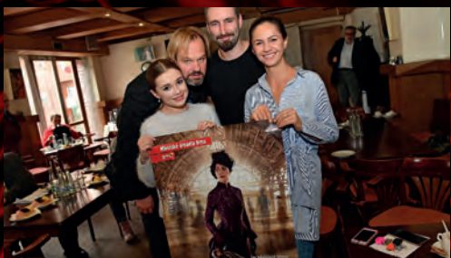
Proběhla tisková konference k dramatu Anna Karenina.