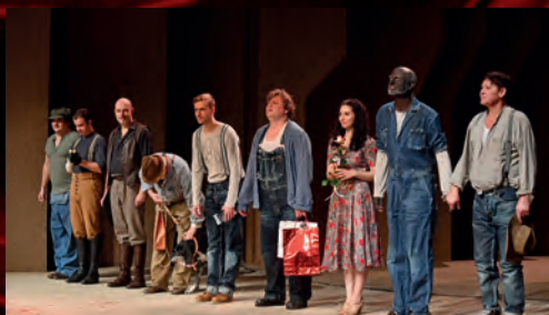
... kterou během 42 repríz celkem vidělo 13 632 diváků.