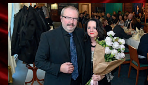
A oslavili jsme premiéru Stingova muzikálu Poslední loď.