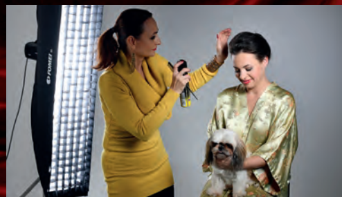
Fotili jsme plakát pro nadcházející premiéru Nebezpečných vztahů.