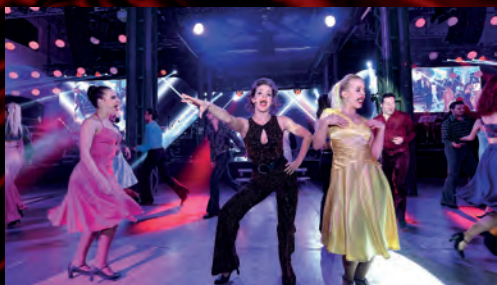
Na plesu v hotelu Voroněž se tančilo ve stylu Horečky sobotní noci.