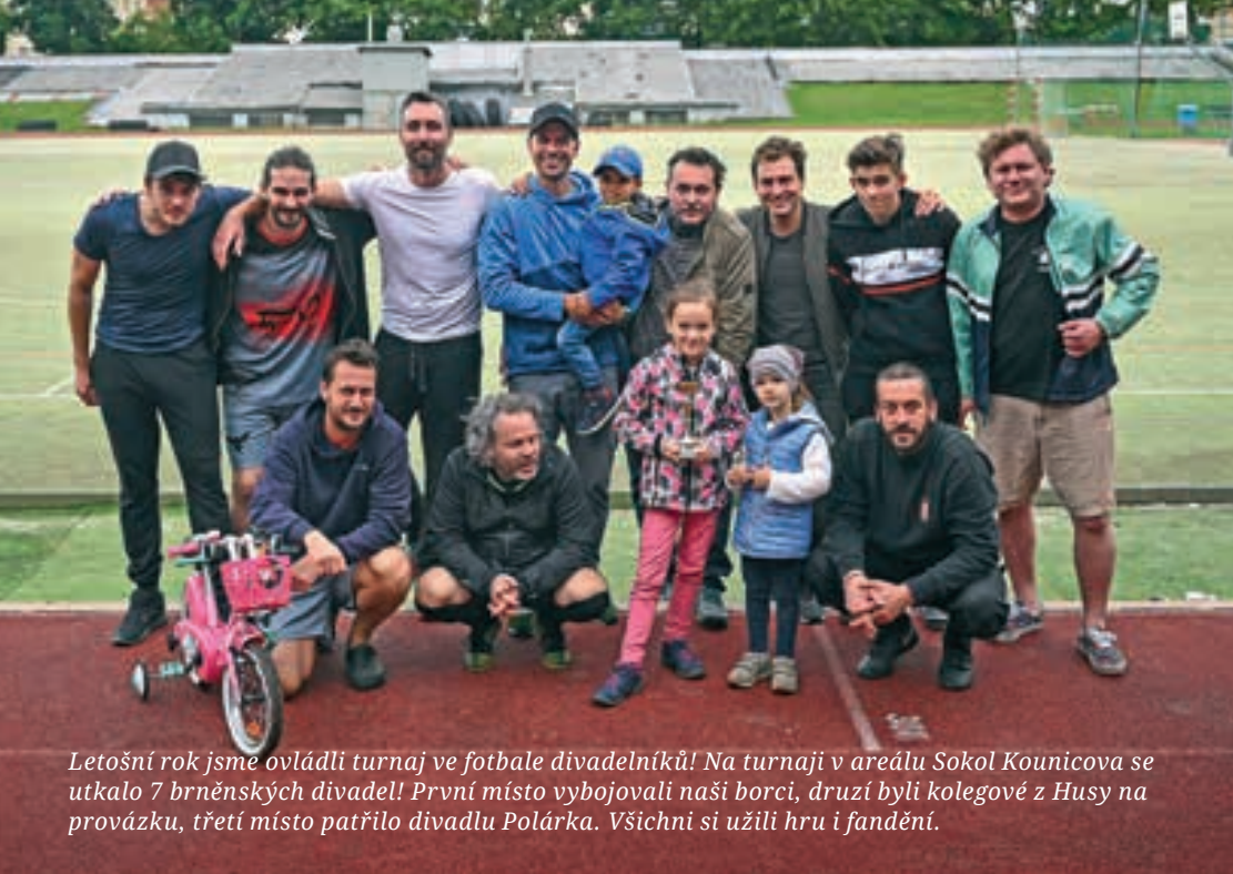
Letošní rok jsme ovládli turnaj ve fotbale divadelníků! Na turnaji v areálu Sokol Kounicova se utkalo 7 brněnských divadel! První místo vybojovali naši borci, druzí byli kolegové z Husy na provázku, třetí místo patřilo divadlu Polárka. Všichni si užili hru i fandění.