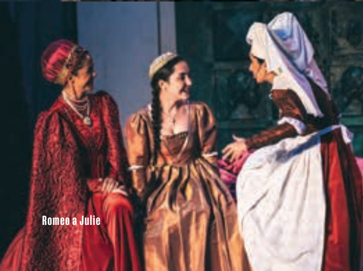
Romeo a Julie