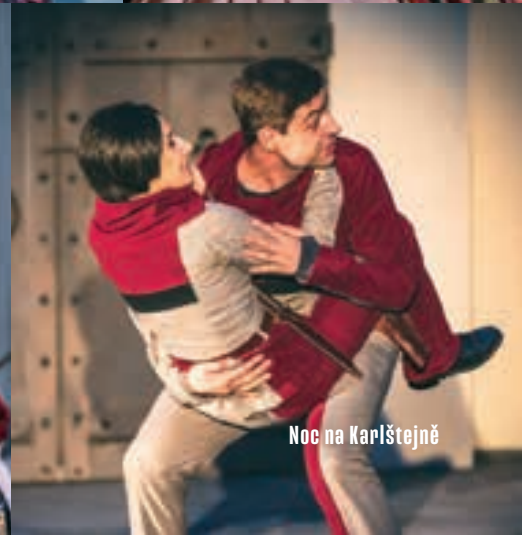
Noc na Karlštejně