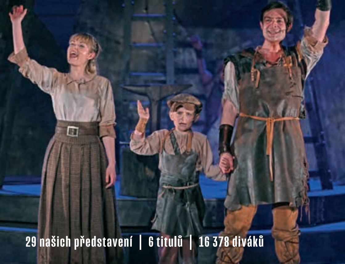
O statečném kováři

29 našich představení | 6 titulů | 16 378 diváků