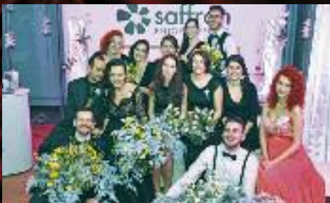
A přidal se ke společnému fotografování.