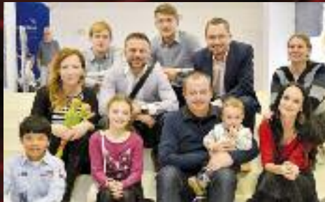
Tvůrčí a herecký tým filmu Ptáci ostrov.