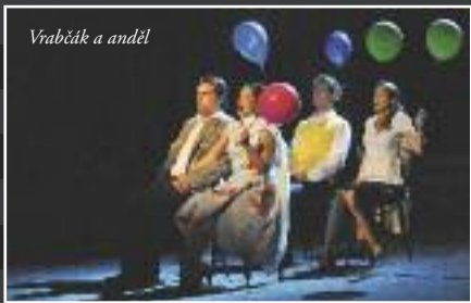
Vrabčák a anděl