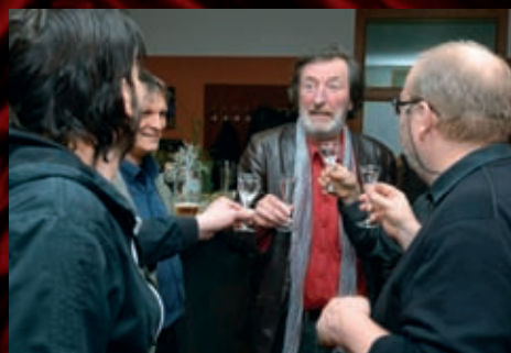
Našla se i chvilka na skleničku.