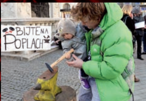
A projevíli tak solidaritu s Činoherním studiem v Ústí nad Labem.