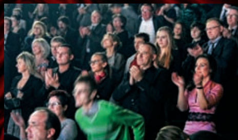
V publiku sedělo i vedení společnosti.