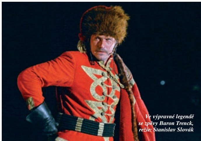
Ve výpravě Legendě se zpěvy Baron Trenck, režie: Stanislav Slovák

Stále častěji se ale představujete jako autor divadelních her – vaše jméno najdeme pod