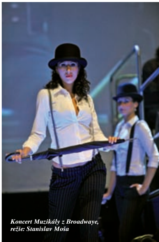
Koncert Muzikály z Broadwaye, režie: Stanislav Moša

Myslím, že funguje harmonicky. Mám spoustu krásných nejen tanečních fotek, a když nedo- razí Tinovi modelka na nějakou akci, bleskově