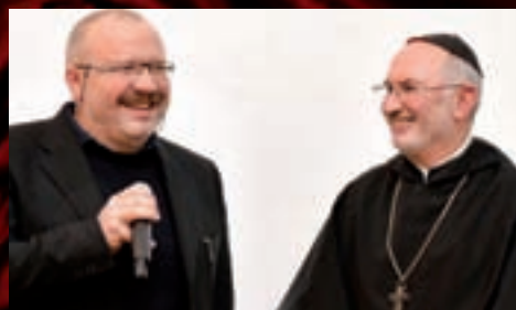
Pan ředitel navštívil starobrněnský klášter,