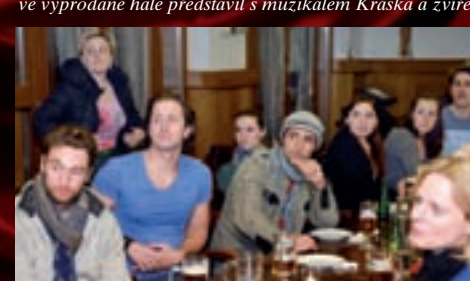
V klubu Nekonečno se sešli účastníci evropského turné,