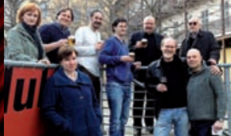
náhodně sešla společnost.