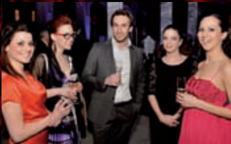
Po měsíci příprav vypukla ve Wannieck Gallery královská zážitková show Ples jako Brno.