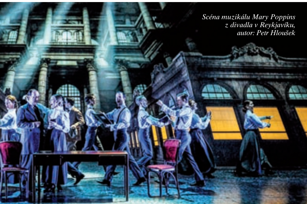
Scéna muzikálu Mary Poppins z divadla v Reykjavíku