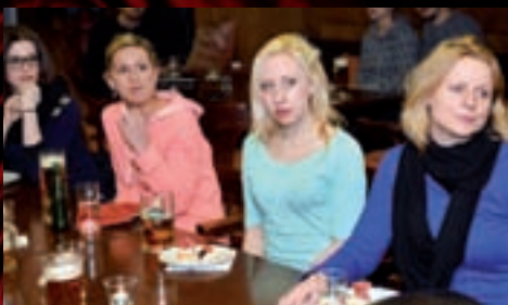
kteřé pořádá naše divadlo s muzikálem Kráska a zvíře.