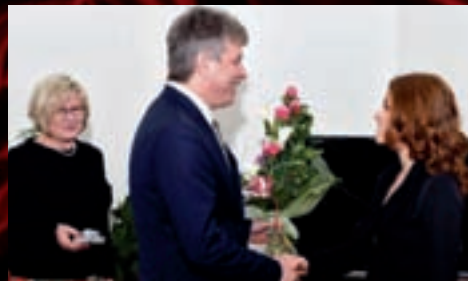
A poblahopřál k získání ceny Herecké asociace za mimořádný výkon v muzikálu Papežka – Ceny Thálie 2012.