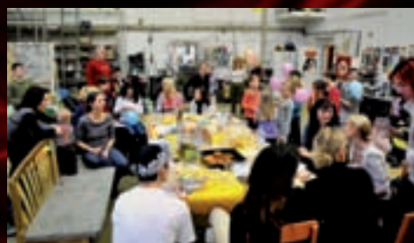
Mezi dětmi přišli kromě rodičů také herci.