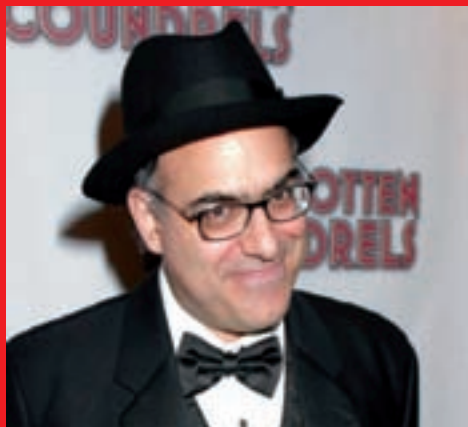
Autor hudby David Yazbek

Druhou květnovou inscenací, kterou vám představíme na Činoherní scéně, je muzikál Donaha! , který si i z těch nejsmutnějších lidských situací umí udělat dokonalou srandu. Co se stane, když se ve městě zavře továrna, která zde živila značnou část mužů? Dělníci se ocitají v nouzi, přestávají být živiteli rodiny, zvažují, zda přijmout i pro ně ponižující, „ženské“ práce, jejich sebevědomí stále více klesá. Zdánlivý námět na pochmurné sociální drama dokázali ovšem autoři britské filmové komedie Donaha! (1997, režie Peter Cattaneo) otočit do komediální polohy – parta nezaměstnaných ocelářů z Sheffieldu se rozhodne jednak vylepšit svou neveselou finanční situaci a jednak získat zpět ztracené sebevědomí netradičním způsobem. Začnou totiž připravovat striptýzové vystoupení, a to bez ohledu na to, že nemají ani postavy, ani dovednosti striptýzových profesionálů. Narodil od nich jsou ale připraveni při svém vystoupení jít až – donaha.