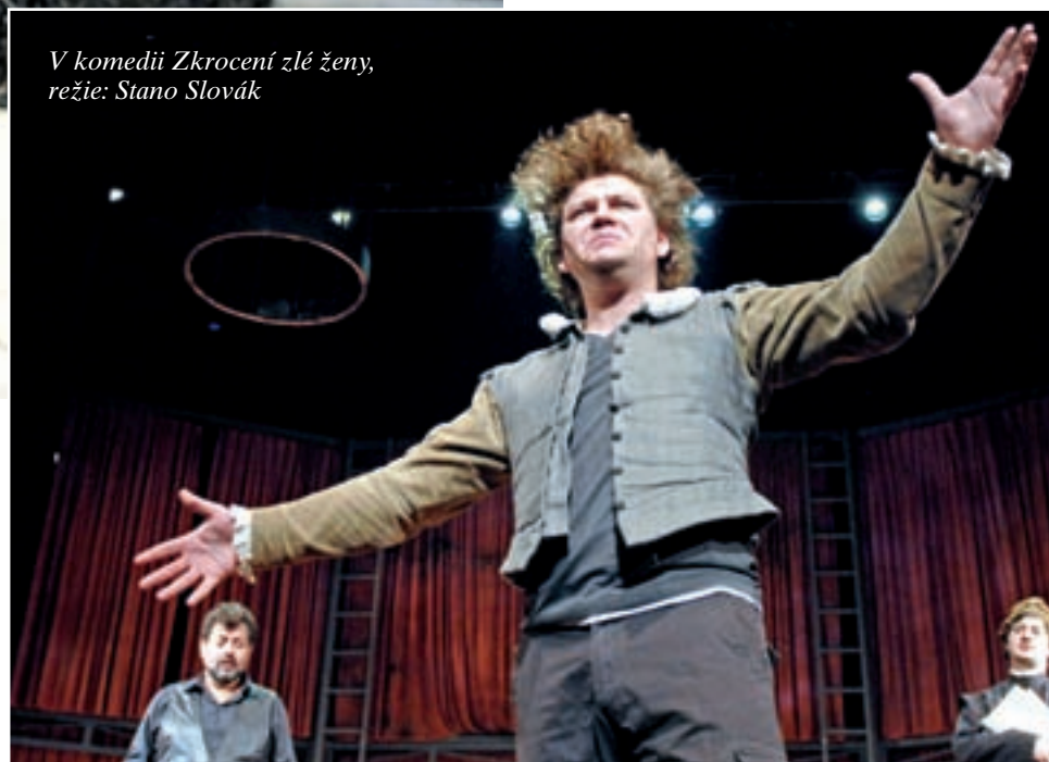
V komedii Zkrocení zlé ženy, režie: Stano Slovák