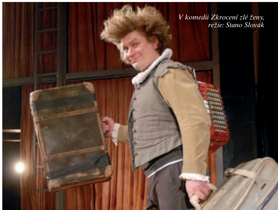
V komedii Zkrocení zlé ženy, režie: Stano Slovák

Ti muži měli respektu hodnou práci, která je naplňovala, a nejsou ochotni přijmout jinou, která by byla pod jejich úroveň. Jistě jsou tu i všeobecně jiná očekávání mužů a žen, např. těžko si chlap dokáže představit, že by