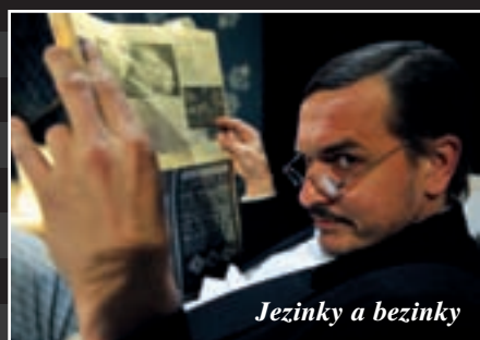
Jezinky a bezinky