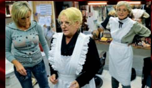
Příprava vizáže dvou hodných tet do komedie Jezinky a bežinky trvala maskérkám několik hodin.