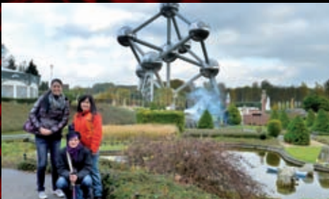
Děvčata ze zákulisí na prohlídce Minieuropa parku v Bruselu.