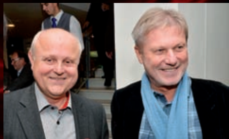
Oslavy se zúčastnil i skladatel Zdeněk Merta.