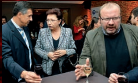
Po představení Jakub a jeho pán v Bruselu se hosté ještě dlouho zdrželi v divadelním klubu.