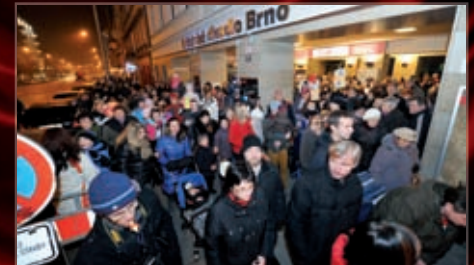
Akce se zúčastnilo mnoho příznivců divadla.