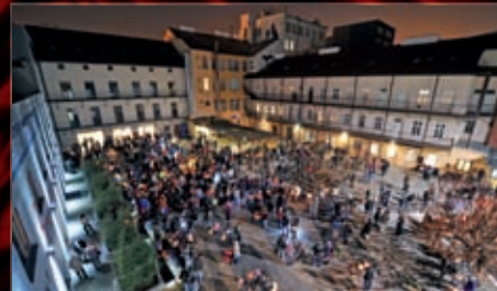
V rámci 1. ročníku mezinárodní akce Noc divadel uspořádala brněnská divadla lampiónový průvod, který vyrazil z našeho Divadelního dvora.