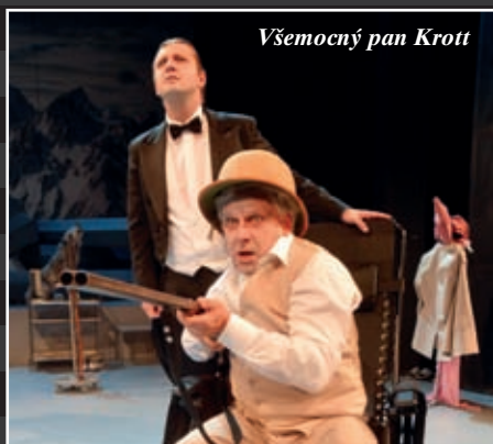
Všemocný pan Krott