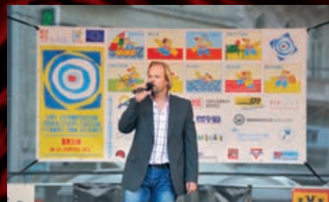
Navíc přímo na náměstí Svobody vztýčil svůj stan Odpolední Radiožurnál a přímými vstupy informoval o dění na hrách a herci MdB se přidali svým vstupem.