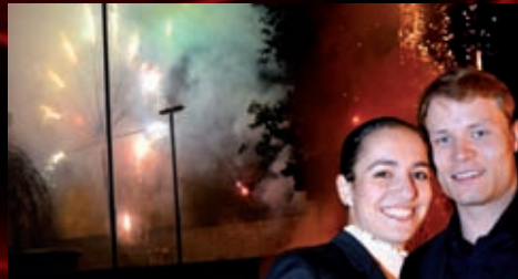
Letošní již patnáctý ročník mezinárodní přehlídky ohňostrojí Ignis Brunensis zakončil koncert na nádvoří hradu Špilberk, mezi účinkujícími nechyběli herci našeho divadla.