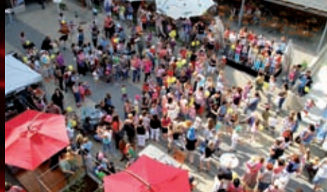
A také sedm trpaslíků.