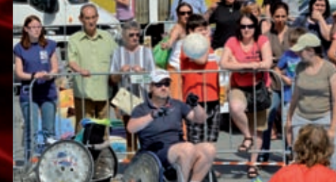
Nadační fond Emil a Liga vozíčkářů přeměnili náměstí Svobody v místo sportu a zábavy, v symbolickou bránu k prázdninám. K nejatraktivnějším aktivitám patřil závod na handbiku.