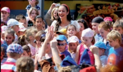
Dětský den na dvoraně MdB připravovaný ve spolupráci s restaurací Boulevard přivedl mezi děti Sněhurku.