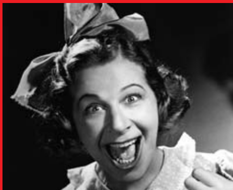
Fanny Briceová - skutečná Funny Girl

Životní osudy hlavní hrdinky připomínají až pohádkový příběh o ošklivém káčátku. Na počátku se setkáváme s dívkou, která v 10. letech 20. století nespĺňuje všeobecnou představu o ženské kráse a vůbec se nehodí do sboru. Ovšem stát se jednou z tzv. „Ziegfeld Girls“ je jejím velkým snem, a tak díky svému nadšení, talentu a odhodlání dokáže překonat počáteční nedůvěru okolí a nakonec se stane hvězdou. Nalolik její síla nespočívala v kráse, natolik ji dokázala kompenzovat svým charismatem, dokonalým zpěvem, a především obrovským smyslem pro humor a komediálním talentem. Z Fanny se stává úspěšná a diváky milovaná žena. Do jejího života záhy vstoupí i osudový muž Nick Arnstein, známý hazardní hráč. Ovšem jejich šťastné manželství se záhy setkává s velkou zkouškou: muž, kterého ze srdce miluje a je ochotna se pro něj všeho vzdát, je příliš hrdý na to, aby od své manželky přijal finanční pomoc a raději se bezhlavě pouští do riskantního nezákonného obchodu, kvůli kterému nakonec skončí ve vězení. Ješitný manžel nedokáže slávu a úspěch své ženy přenést přes srdce a nakonec zpočátku tak ideální vztah končí rozpadem a Fanny zůstává sama jen se svou oslnivou kariérou.