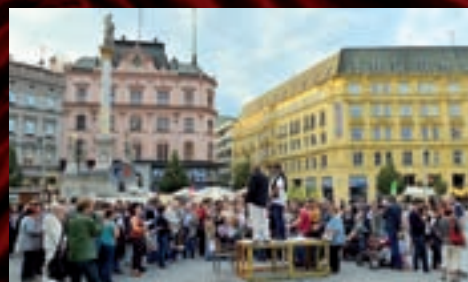
Dvanáct míst, dvanáct děl, dvanáct autorských čtení. V Lisabonu, Londýně, Paříži nebo v Sofii jsou na to zvyklí dávnou, do Brna přišel fenomén Noci literatury letos poprvé.