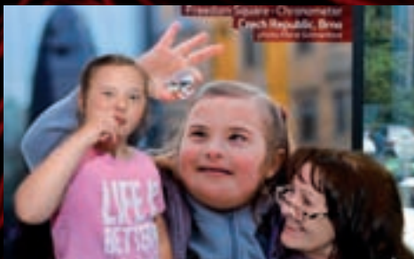
Putovní výstava velkoplošných fotografií dětí s Downovým syndromem docestovala z Budapešti a Košic do Brna. V Městském divadle ji slavnostně zahájil primátor Roman Onderka.