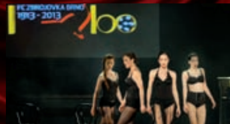
Slavnostní večer zpestřilo i známé číslo z muzikálu Chicago.