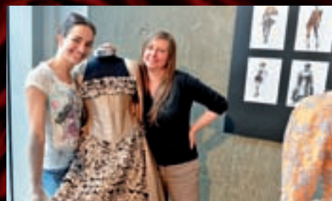
... která přišla výtvarnici také pográtulovat. Tato výstava potrvá do prosince 2013.