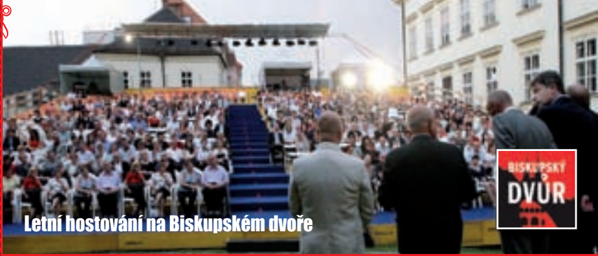
Letní hostování na Biskupském dvoře