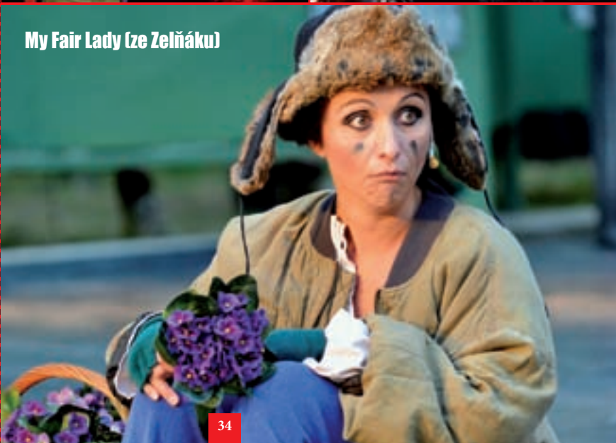
My Fair Lady (ze Zeliňáku)