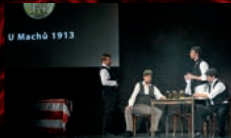
„Osłavy 100 let FC Zbrojovka Brno“ proběhly na Činoherní scéně za účasti našich herců.