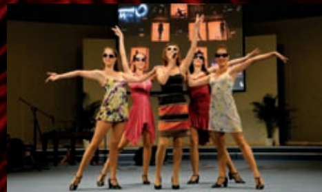
V rámci veletrhu THEATRE TECH se představili i naši umělci.