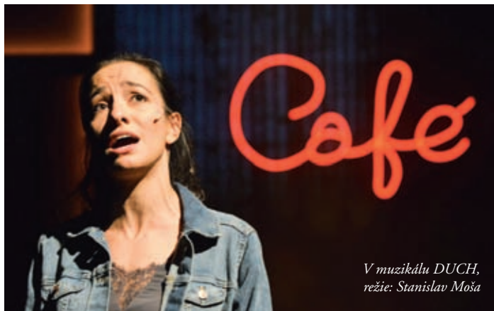
V muzikálu DUCH , režie: Stanislav Moša

a to zejména v průběhu zkoušení. Záleží hodně na tom, jak je role náročná na text, celkové ztvárnění, pěveckou nebo fyzickou kondici. Takže v mnoha případech práce na roli pokračuje i ve volném čase, mimo zkoušky. Když máme na nazkoušení nového kusu něco