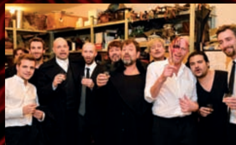
Po premiéře Prince Homburského spadlo napětí a byl čas na skleničku.