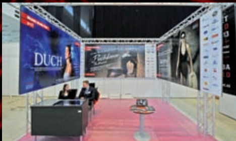
Prezentovali jsme se na prvním ročníku veletrhu divadelní a jevištní techniky THEATRE TECH 2014.