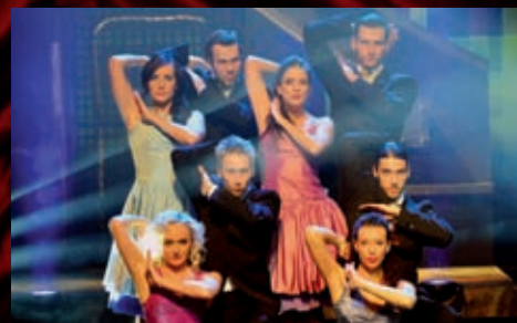
Celý pořad natočilo brněnské studio České televize.