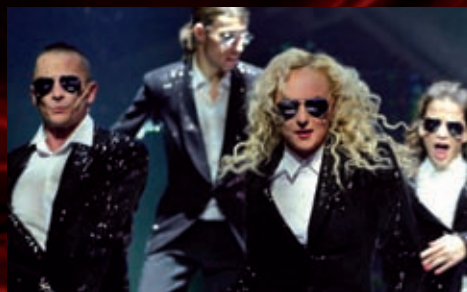
Divákům zatančily naše hvězdy.