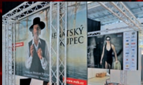
Veletrh probíhal na brněnském Vystavišti začátkem listopadu a byl určen pro širokou veřejnost.